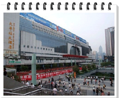
Lowu Shopping Centre

เช้า รับประทานอาหารเช้า ณ โรงแรมที่พัก...นำท่านชมสวนสาธารณะดอกบัวขาว หรือ "วัดไป๋เหลียนตัง" เป็นวัดเล็กๆ ที่มีวิวทิวทัศน์สวยงามมาก ภายในบริเวณวัด จะมีบันไดเดินขึ้นไปกราบนมัสการสิ่งศักดิ์สิทธิ์ที่ชาวจู่ไห่ให้ความนับถือ ให้ท่านกราบนมัสการ ได้แก่ เจ้าพ่อกวนอู, เจ้าแม่กวนอิม, และเทพเจ้าไฉ่ซิงเอี้ยะ (เทพแห่งโชคลาภ) ตามบันไดที่ขึ้นไปทั้งสองข้างทางจะมีต้นสนปลูกไว้ตลอดสองข้างทาง บรรยากาศร่มรื่น เมื่อท่านได้กราบไหว้สิ่งศักดิ์สิทธิ์ภายในวัดครบหมดแล้ว บริเวณด้านนอกก็จะมีระฆังไว้ให้คนที่ไปขอพรดี เพื่อให้พรที่ขอสมดังที่ปรารถนา ในการตีฆานอกให้ตี 3 ครั้ง แล้วพรที่ขอก็จะสัมฤทธิ์ผล ...จากนั้นแวะชม ร้านสมุนไพรจีน(ยา) แหล่งค้นคว้ายาแผนโบราณ หรือเป่าฟู่หลิง หรือที่เราเรียกว่า "บัวหิมะ" ยาประจำบ้านที่มีชื่อเสียงและมีสรรพคุณมากมาย ช่วยรักษาแผลจากการโดนความร้อนเช่น น้ำร้อนลวก หรือน้ำมัน ช่วยลดการอักเสบและเกิดหนองบวมแผลที่โดนลวกได้ดี ผ่อนคลายด้วยการนวดฝ่าเท้า พร้อมฟังการบรรยายสรรพคุณของสมุนไพร